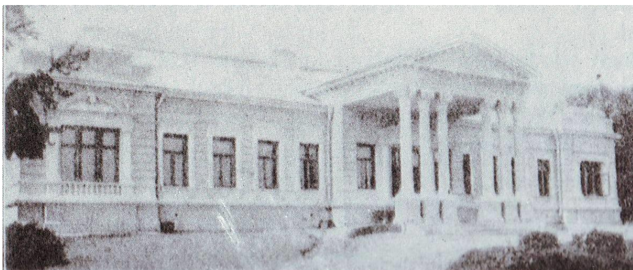
Дворец Карницких, село Рогачи, фото начала XX века

Материалы Всеобщей переписи населения по селу Рогачи в Государственном архиве Киевской области (ГАКО) не сохранились.