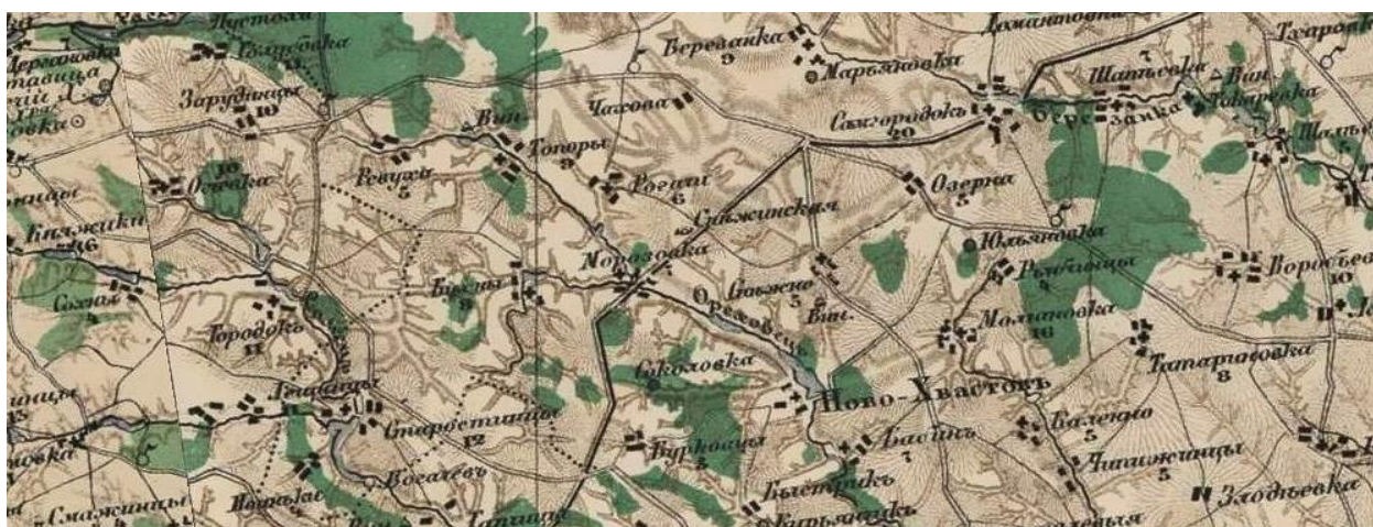
Карта местности, 1871 год

Исходя из этого, была выдвинута версия о происхождении рода Кучеренко из села Рогачи. Стоит отметить, что данный населенный пункт располагался по соседству от села Морозовка в шести километрах.