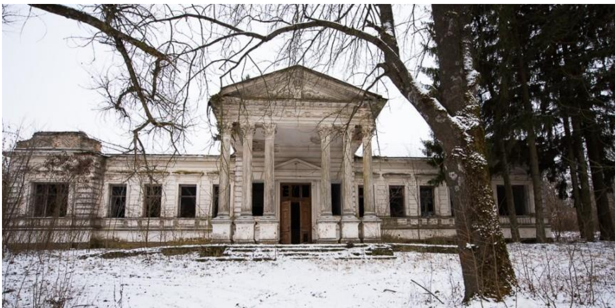
Руины дворца Карницких, село Рогачи, современное фото